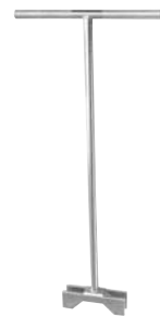
かみ込み時の解除用工具